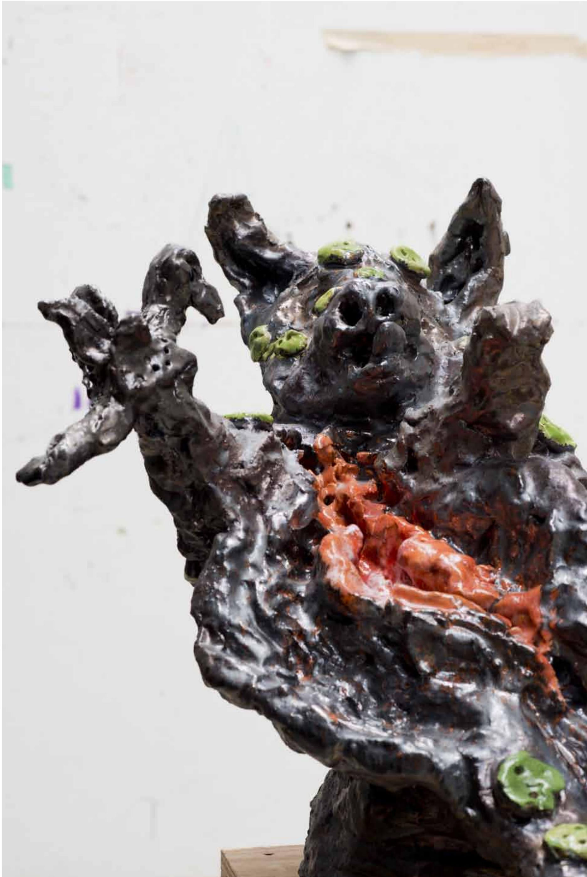
Louis Knoop / 2012 / 60 x 44 x 55 cm