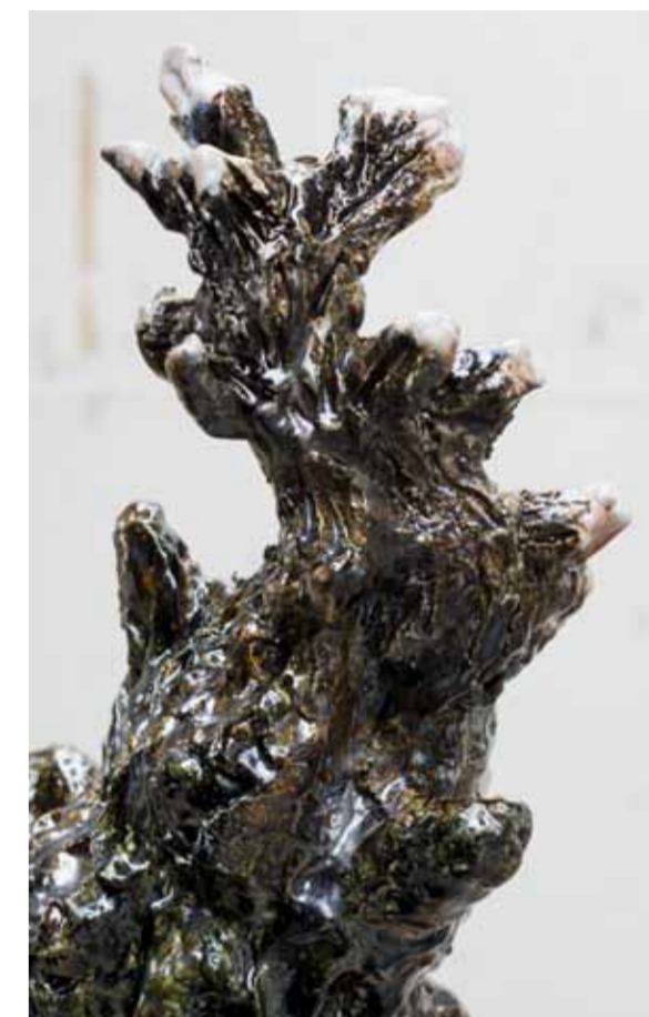
Oeroelolu / 2013 / 61 x 35 x 33 cm