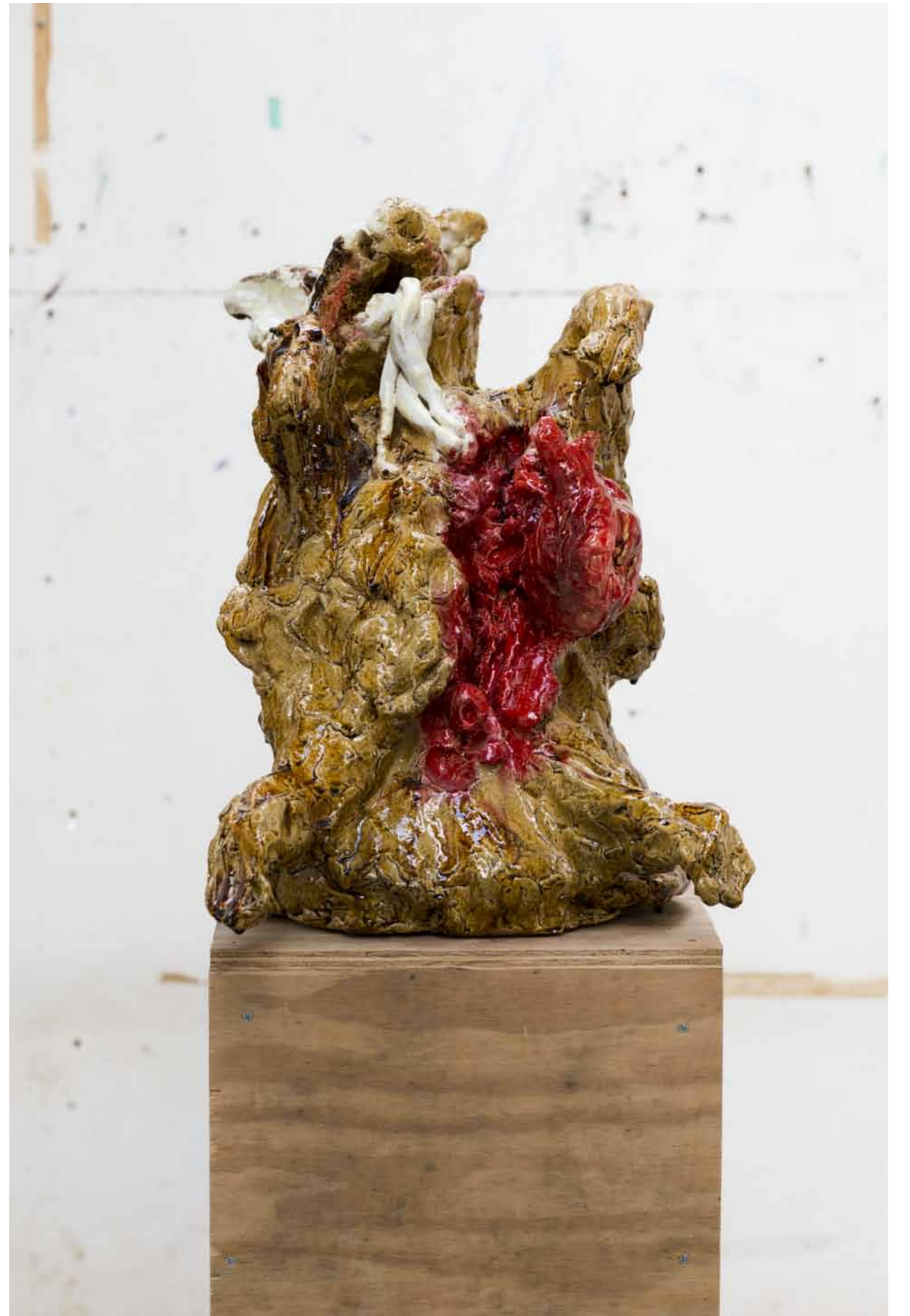
Donor Lamberti / 2012 / 75 x 45 x 60 cm