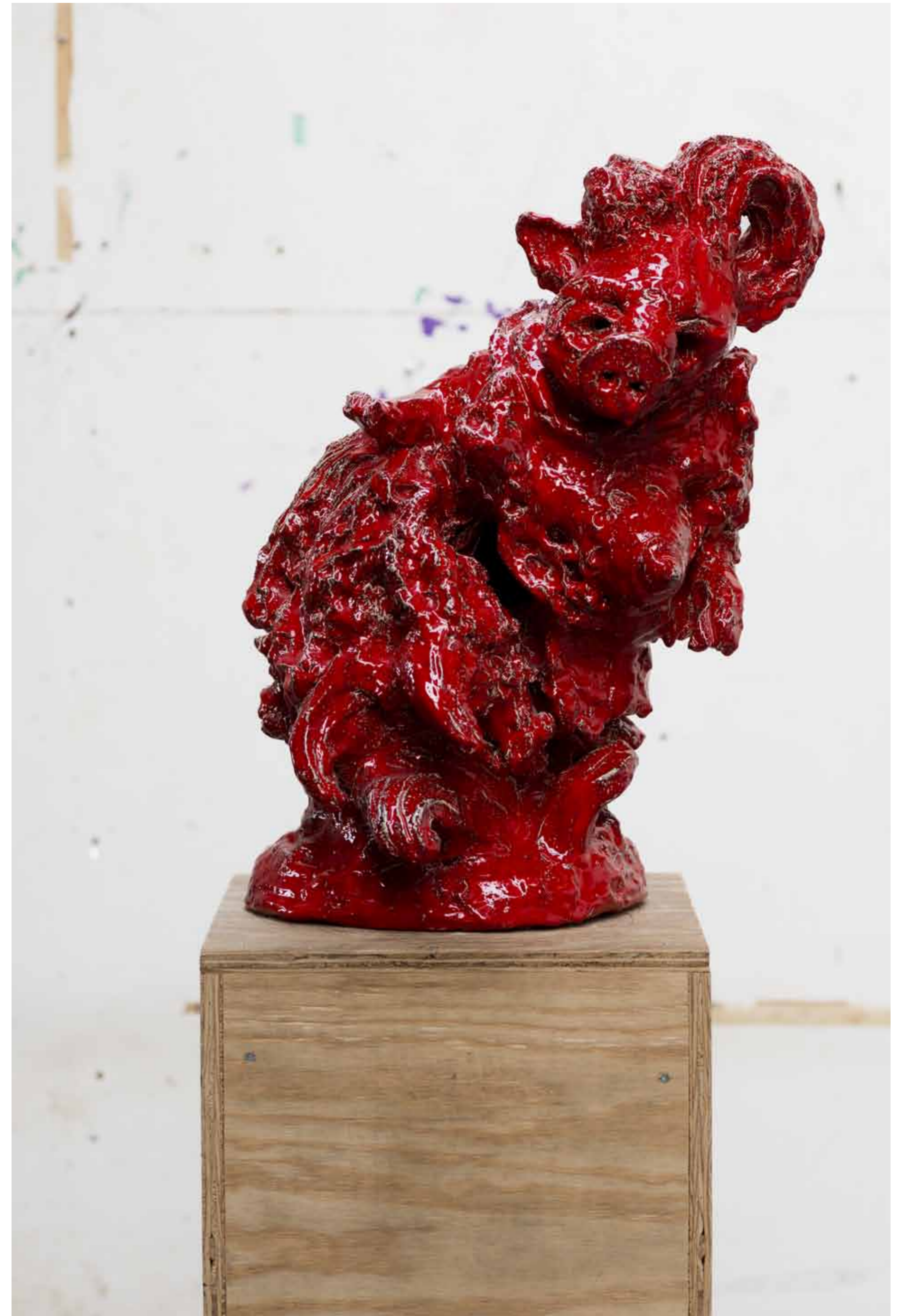
Lolita / 2011 / 63 x 42 x 47 cm