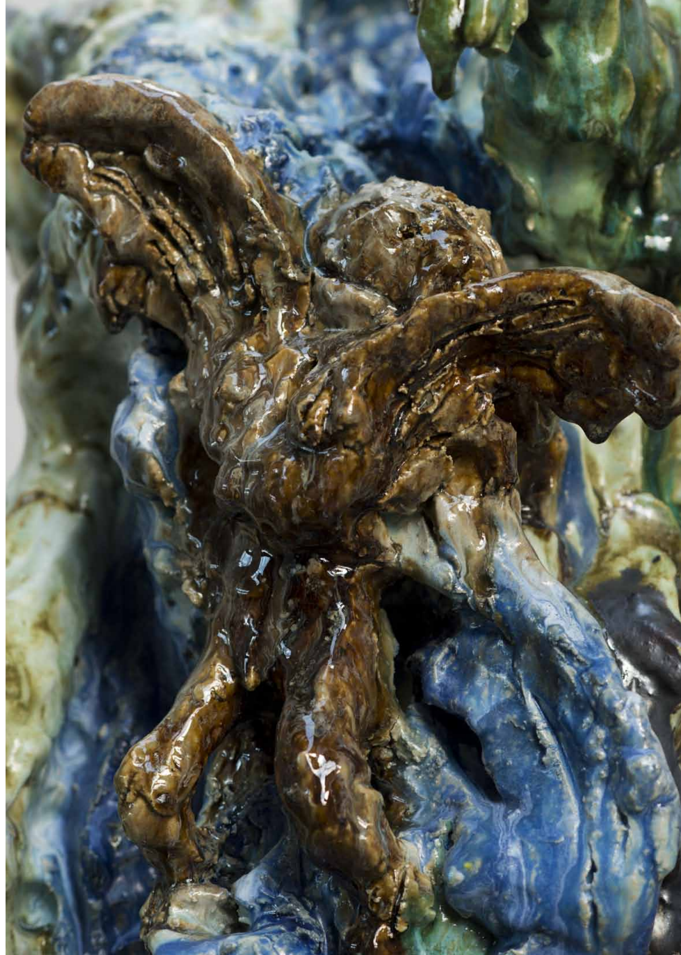
Vierge Catherine / 2012 - 2013 / 85 x 50 x 54 cm