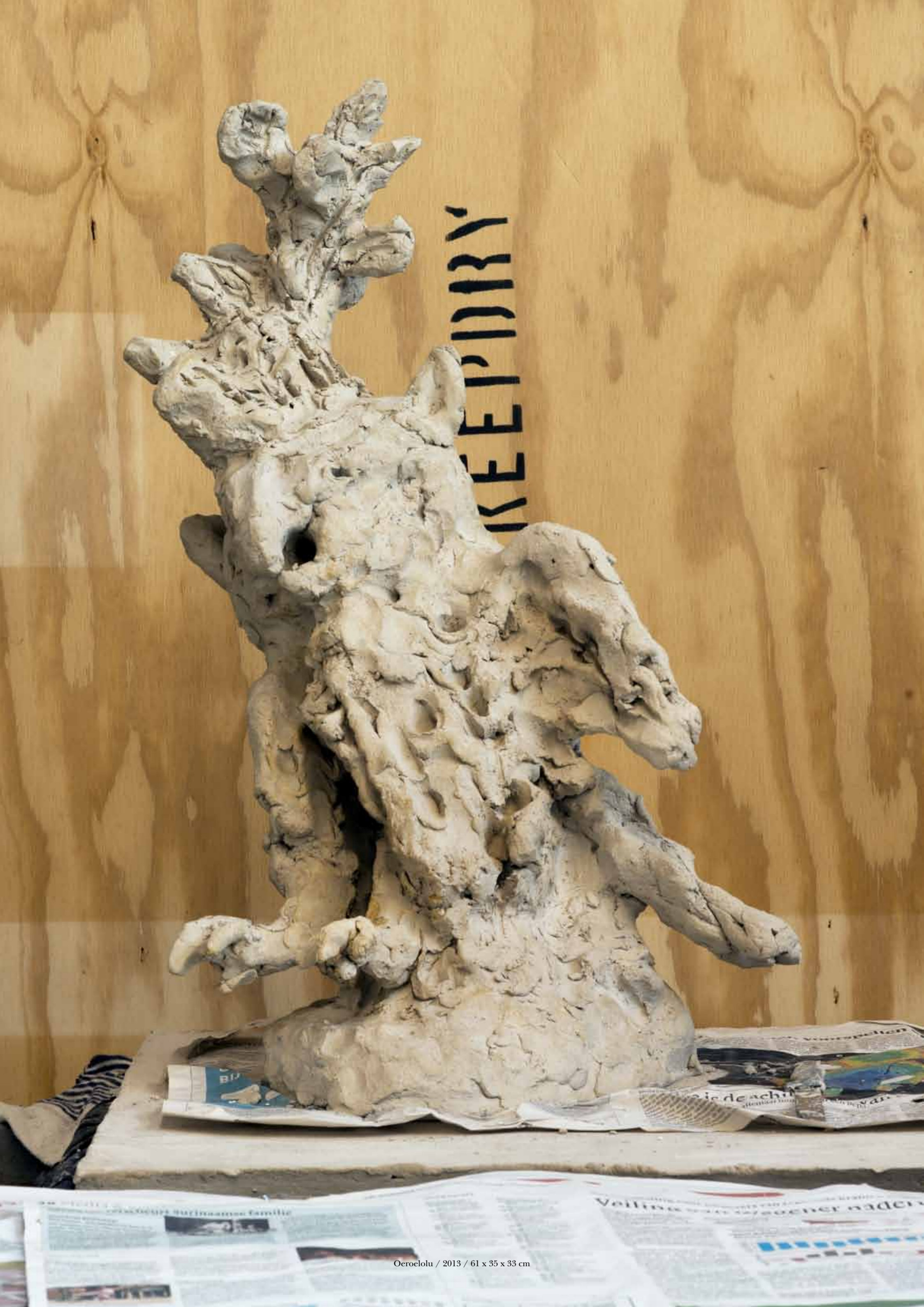
Oeroelolu / 2013 / 61 x 35 x 33 cm