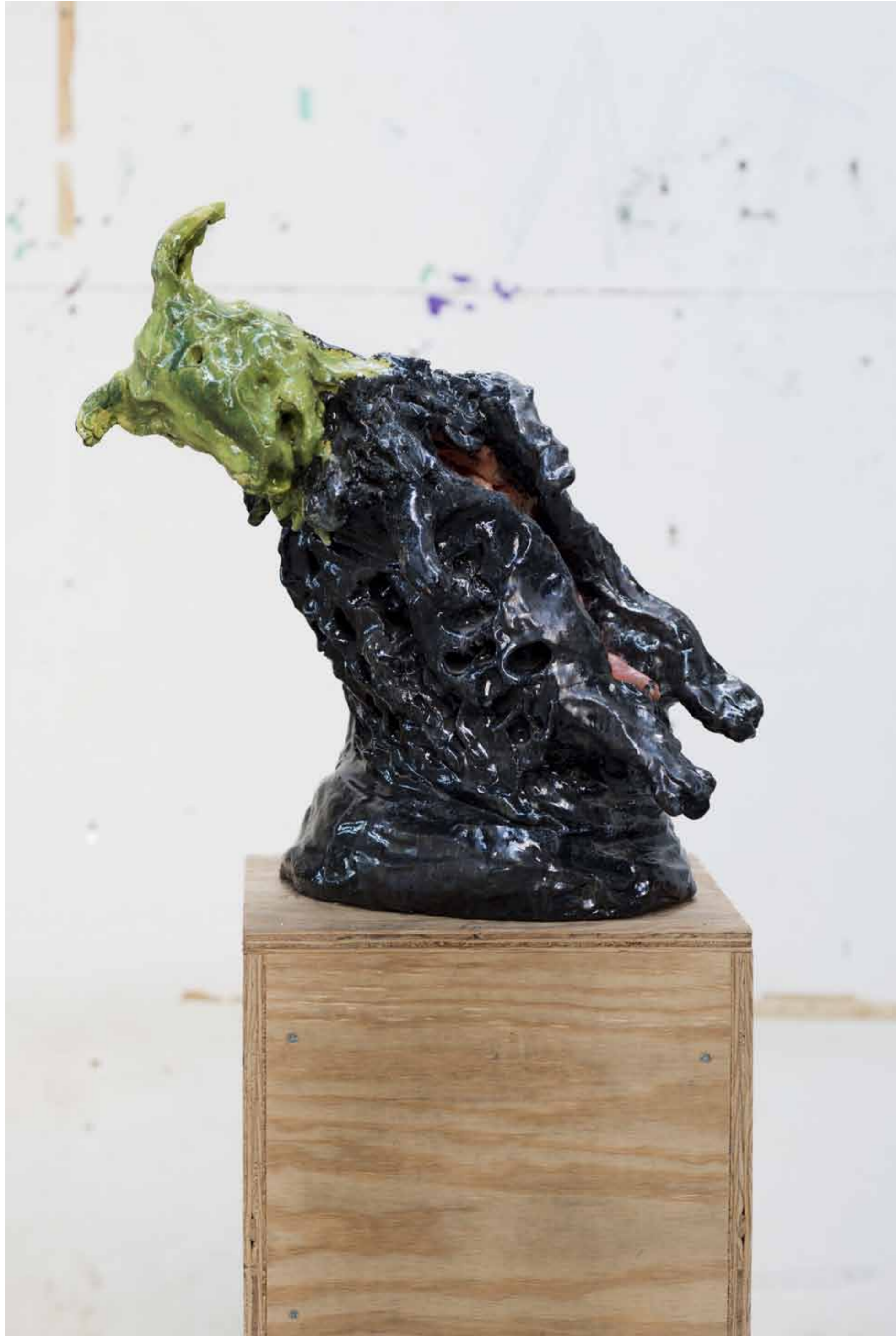
Cross Sheep (short hair) / 2011 / 58 x 34 x 47 cm