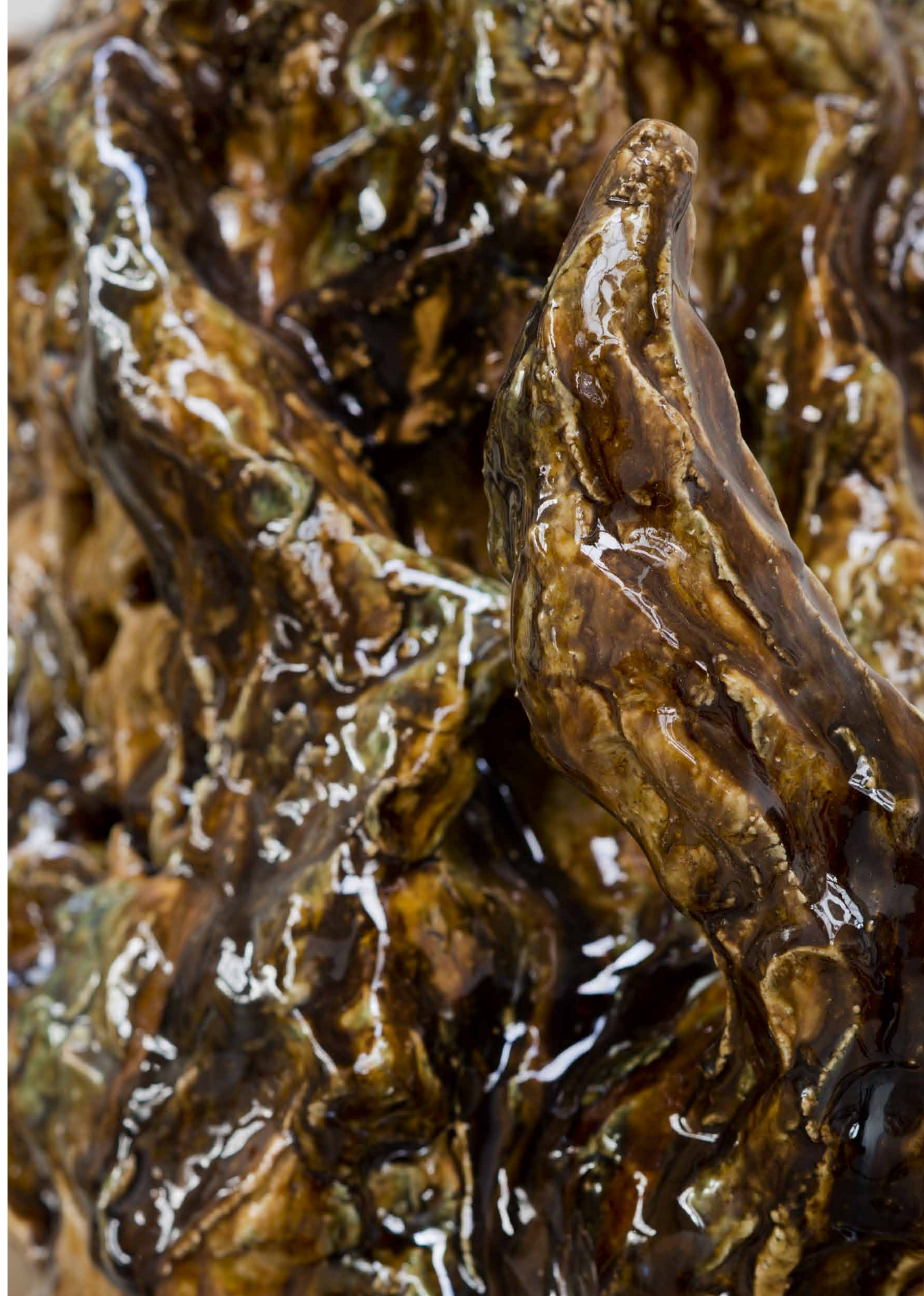
Franz Wießel / 2012 / 67 x 41 x 48 cm