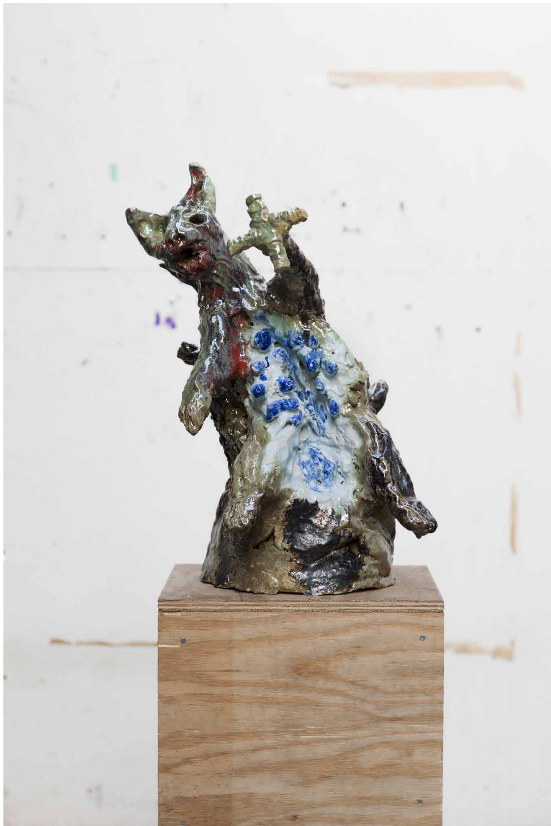
Gatto di Napoli / 2011-2012 / 64 x 42 x 48 cm (private collection Belgium)