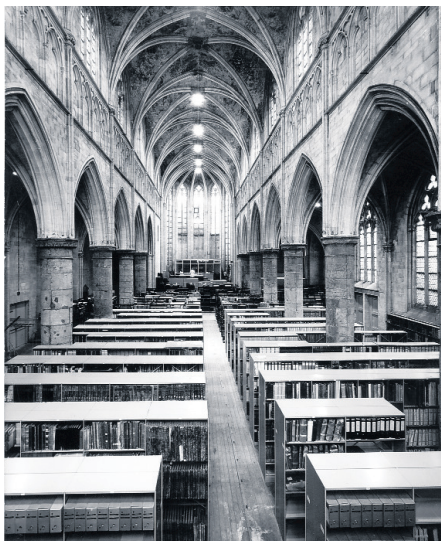
De Maastrichtse bibliotheek in de Dominicanenkerk.