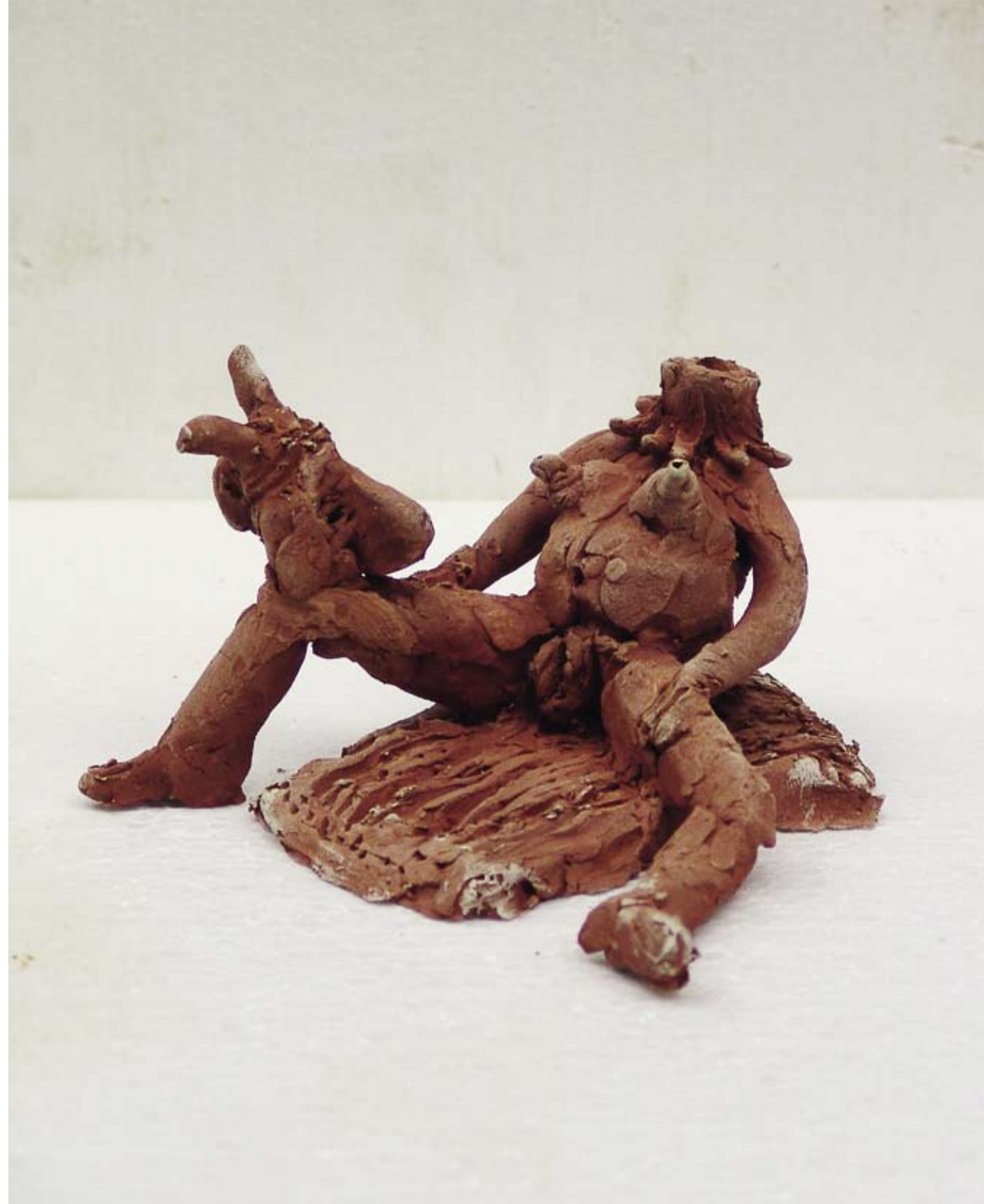
Zeezicht, 2010 / 9 x 16 x 16