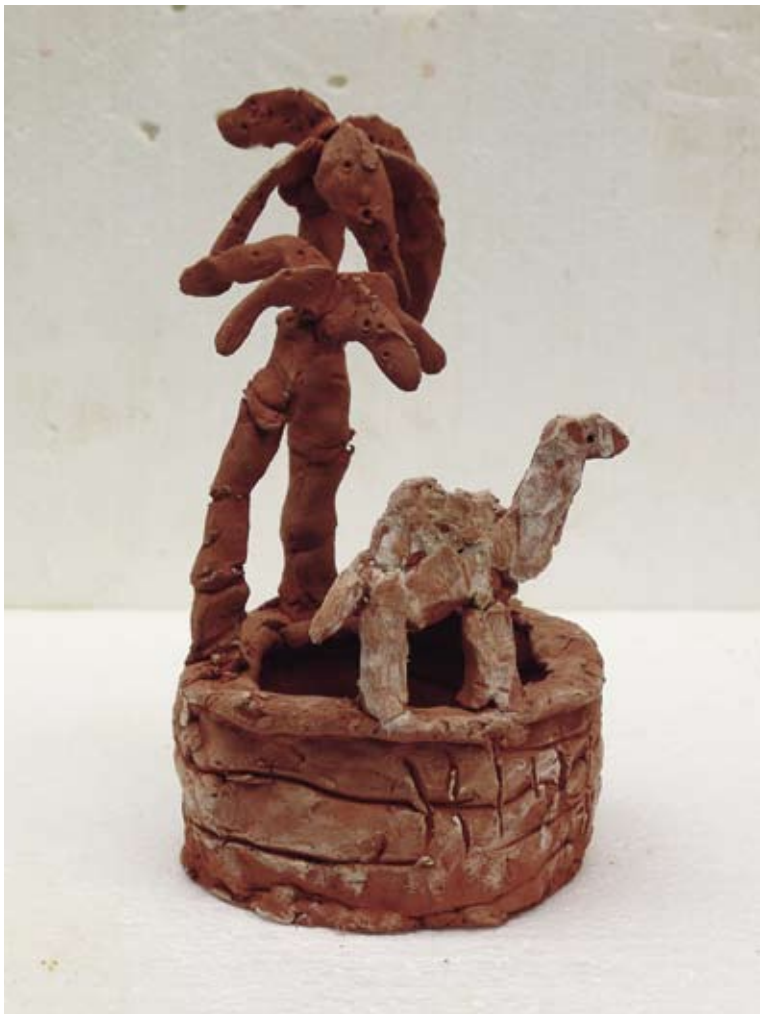
Oase, 1997 / 21 x 12 x 12