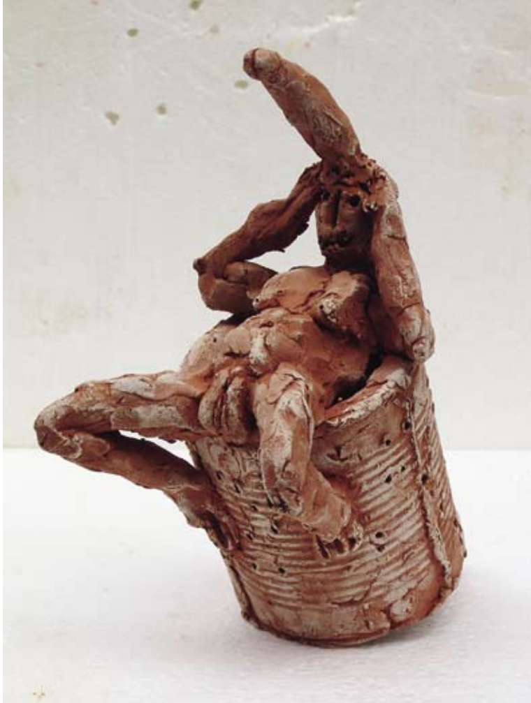
Beperkt houdbaar, 2005 / 26 x 13 x 18