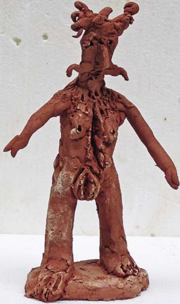
Vrouw met snor, 2010 / 21 x 12 x 7