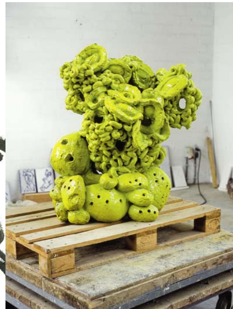
Pastis, 2006 / 100 x 65 x 75