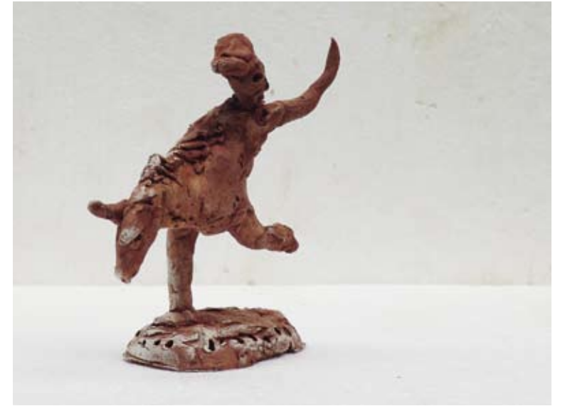
Rodeo, 2010 / 14 x 13 x 6