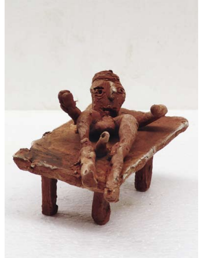
Goedemorgen, 2010 / 10 x 16 x 9