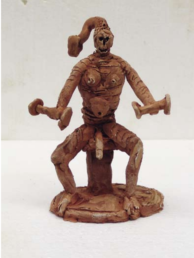
Fitness, 2010 / 19 x 13 x 8