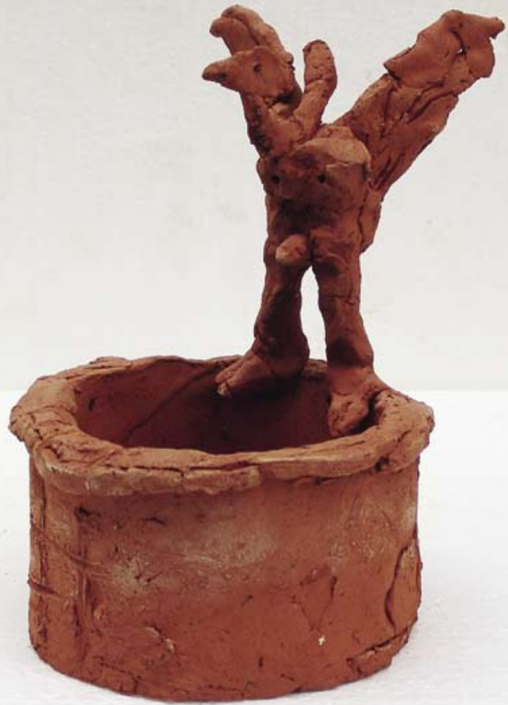
Vleugellam, 1997 / 18 x 12 x 12