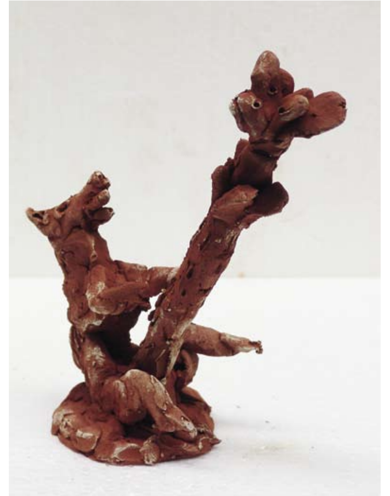
Acrobaat, 2010 / 18 x 7 x 15