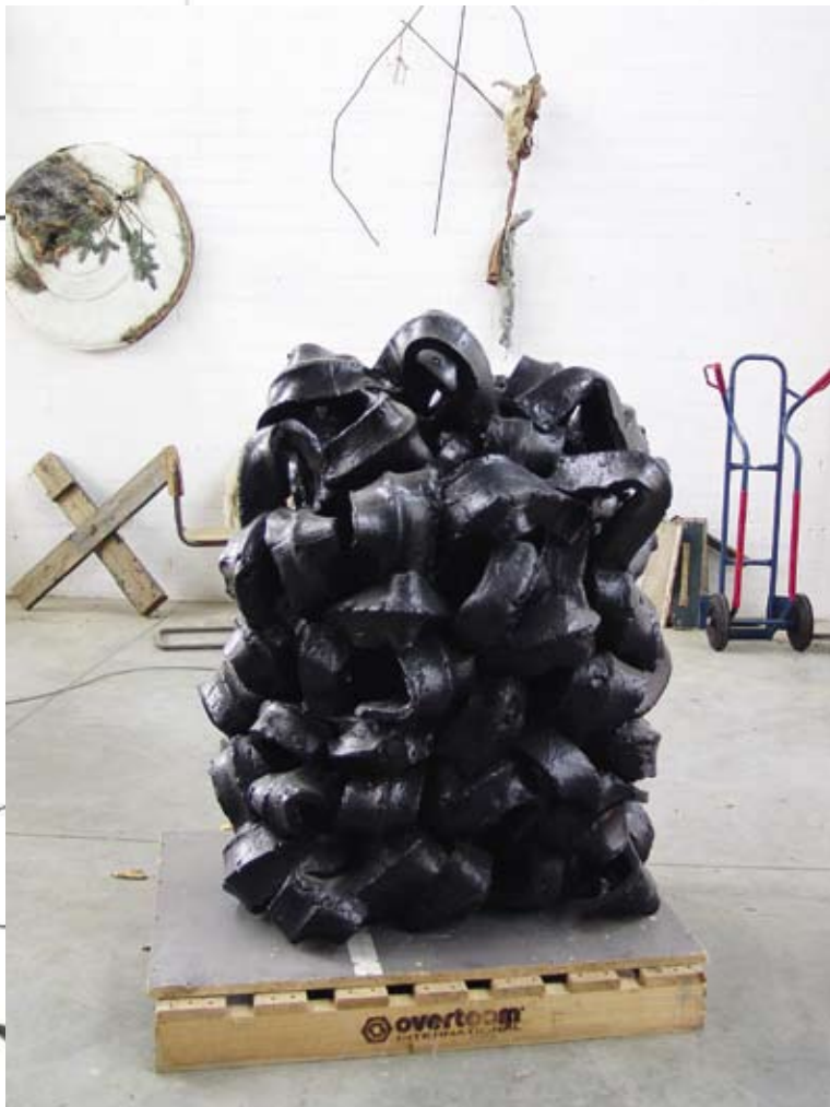
Pastille, 2008-2010 / 118 x 90 x 80