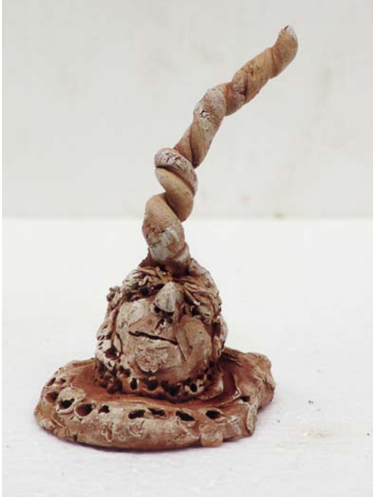
Saffraan, 2010 / 12 x 6 x 8