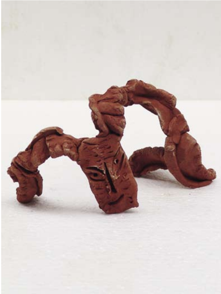
Tandsteen, 2010 / 9 x 18 x 7