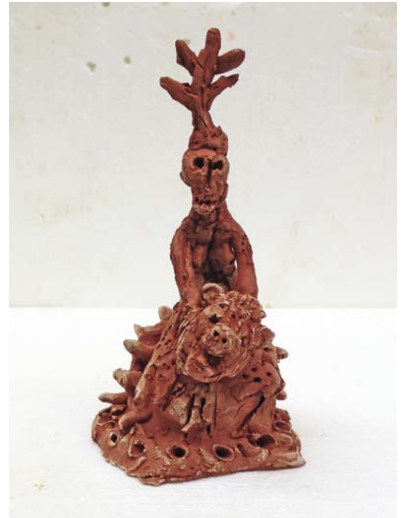
Easy Rider, 2010 / 29 x 11 x 14