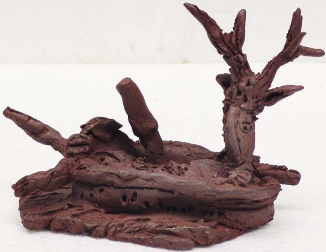
Deer hunter, 2009 / 10 x 13 x 7