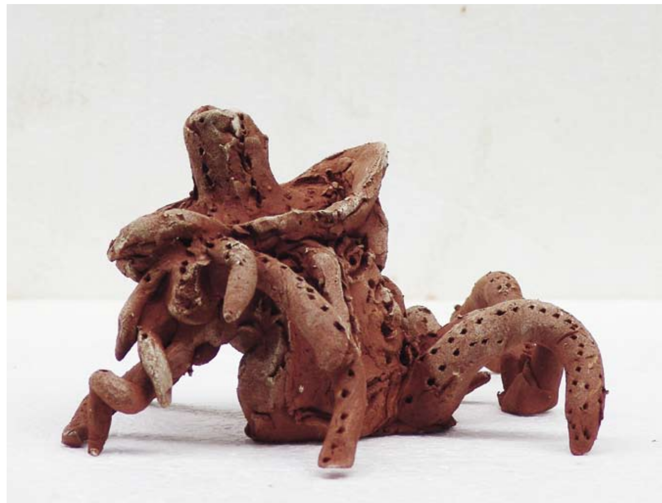
Silvo, 2010 / 10 x 20 x 15