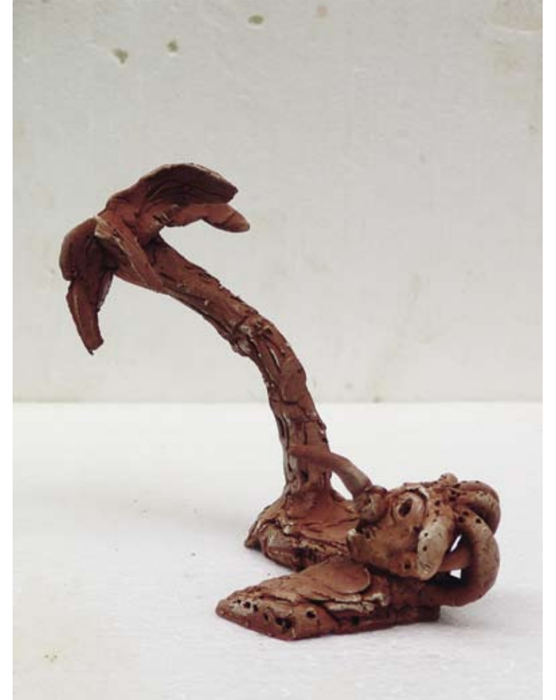
Neusspray, 2010 / 15 x 15 x 11