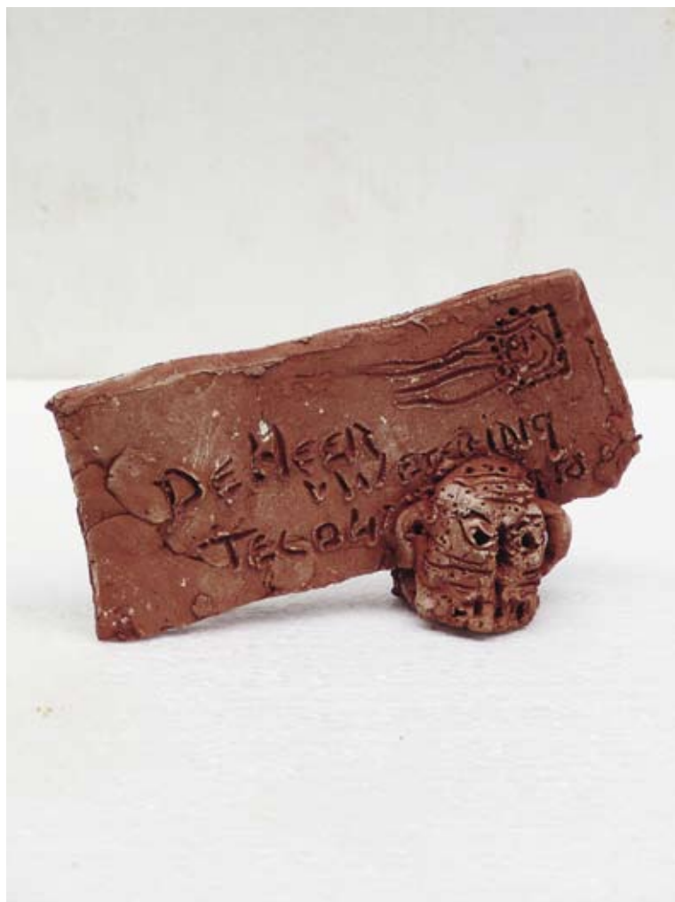
TNT Onvoldoende frankering, 2010 / 11 x 17 x 6