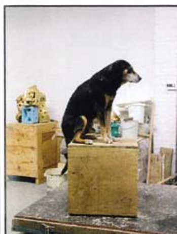
Y PANCINO. 158