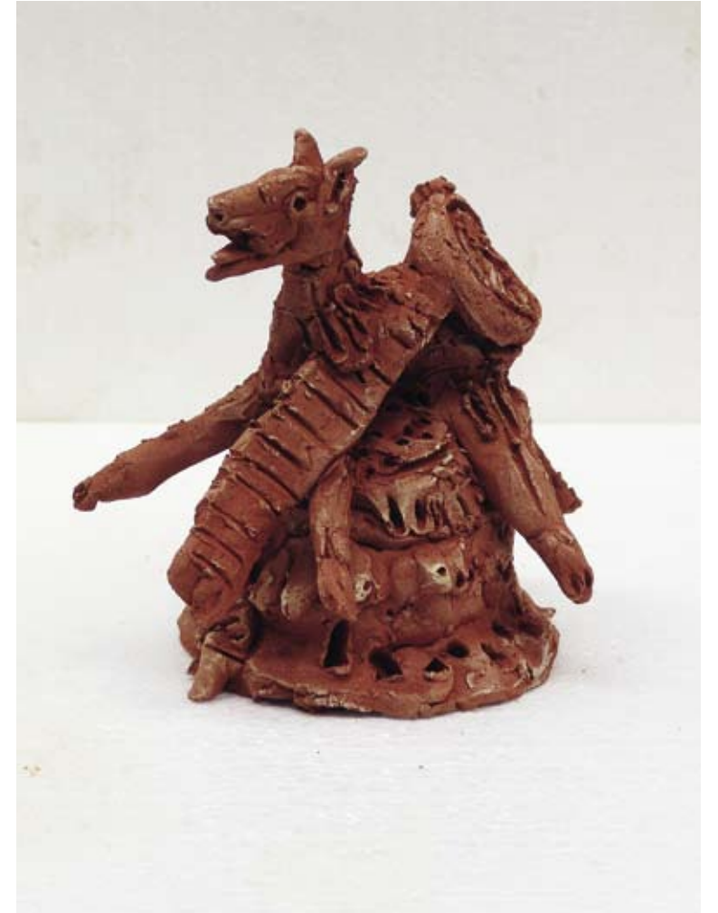
Rolex, 2010 / 17 x 12 x 15