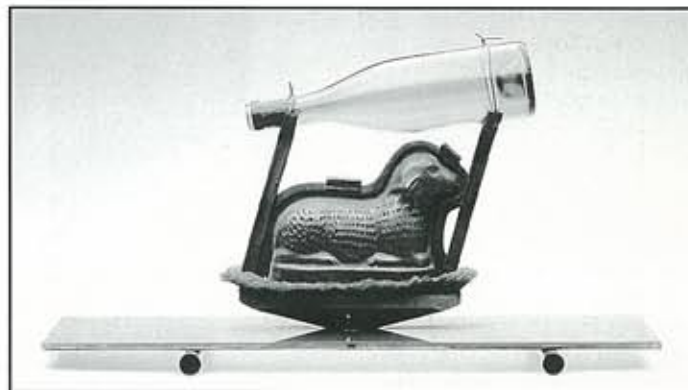
Château Mouton, 1983, brons, glas, koper, 62x20x32cm

Voorpagina: Ferdinand, Mellow Yellow High , 1966, coll. Bonnefantenmuseum