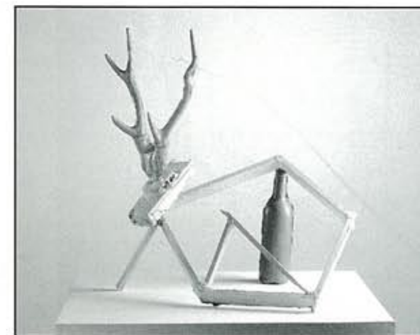
Overstekend wild, 1997, gepolychromeerd brons, 66x61x38cm, collectie Bonnefantenmuseum